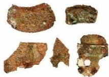
Позолоченная бронзовая корона

Гробница Чончхон, Бокамни, Наджу Национальный исследовательский институт культурного наследия Наджу Период трёх государств