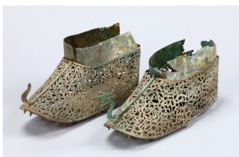
Бронзовые позолоченные туфли с узором

Гробница Чончхон, Бокамни, Наджу Длина 32,0 см Национальный исследовательский институт культурного наследия Наджу Период трёх государств