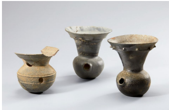
Кувшин с широким горлом и отверстием

Гробница Чончхон, Бокамни, Наджу Гробница Чосан, Вольсонни, Хэнам Руины Тэдокри, Чансон