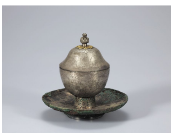
Серебряная чаша с бронзовой подставкой

Гробница короля Мурёнг, Конджу Высота 15,0 см Национальный музей Конджу Период трёх государств