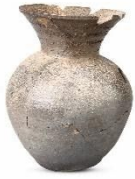
Артефакт, найденные в гробнице