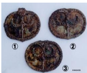
Подвеска на лошадиный ремень

Гробница №3, Бокамни, Наджу Национальный музей Наджу Период трёх государств