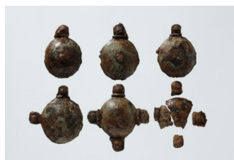
Крепления для ремня

Гробница №3, Бокамни, Наджу Национальный музей Наджу Период трёх государств