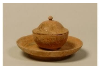
Чашка и подставка из зелёной глазури

Гробница №1, Бокамни, Наджу Высота 11,5 см Музей Национального университета Чоннам Период трёх государств